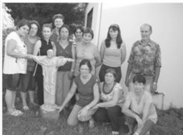
Oficinistas de Lacerdópolis - SC

(colaboração: Oficina de Oração e Vida – Joaçaba)